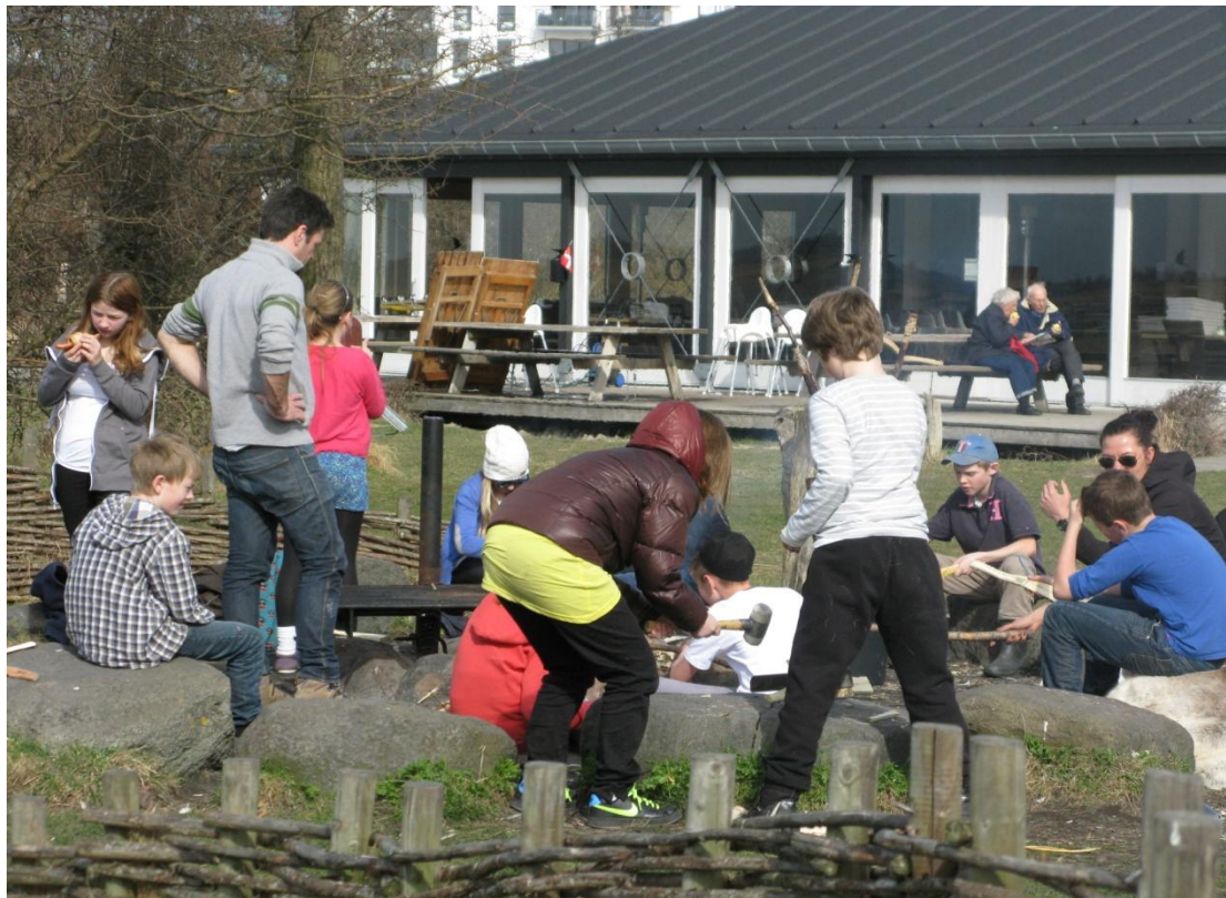
Frá námsdvöl framkvæmdastjóra í Kaupmannahöfn. Myndin sýnir náttúruskóla á Amager.

Tekið var á móti hópum af finnsku og norsku skógarfólki úti í skógi sem var í skoðunarferð um íslenska skóga á vegum Skógræktarfélags Íslands. Einnig var tekið á móti grunn- og leikskólahópum um jólin sem komu að ná í jólatré fyrir sína skóla.