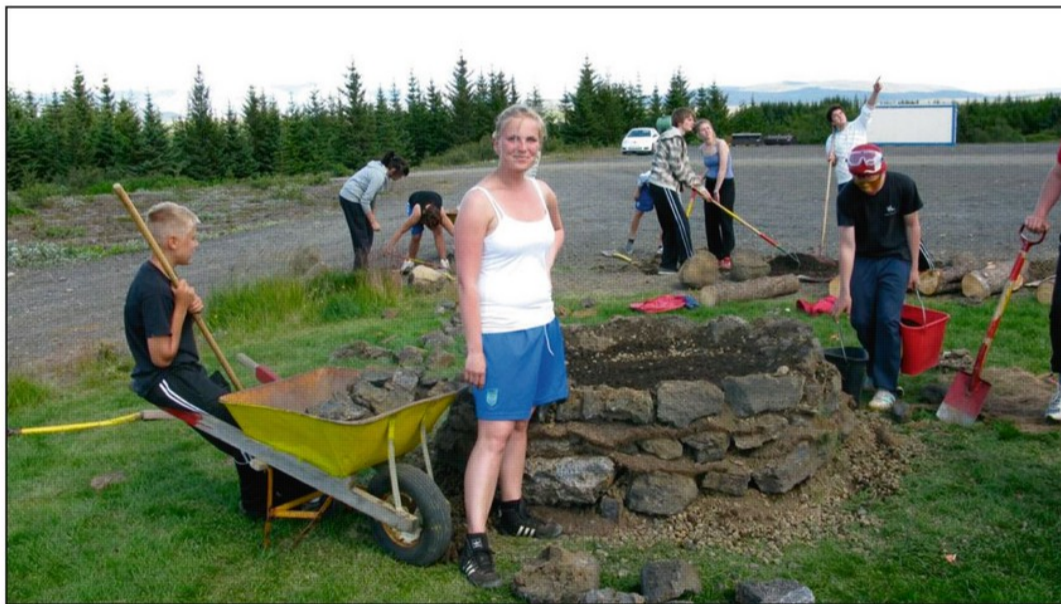
Unglingar frá Vinnuskóla Reykjavíkur vinna við að hlaða bekkinn góða ásamt verkstjóra sínum.

Á undanförunum árum hefur Vinnuskóli Reykjavíkur komið myndarlega að málum í Heiðmörk og hafa unglingar á hans vegum unnið margt þarfaverkið. Á síðastliðnu sumri störfuðu þau að endurbótum á stígum eins og áður hefur verið getið um. Í lok sumars færðu þau sínar vinnubúðir að Borgarstjóraplani þar sem þau byrjuðu á að snyrta planið vel til og fóru svo að vinna að hleðsluverkefni sem þeim hafði verið falið. Hlóðu þau þar hringlaga bekk úr torfi og grjóti. Þessi bekkur mun gegna margþættu hlutverki í framtíðinni. Að sjálfsögðu er hægt að tylla sér á hann að loknum góðum göngutúr, einnig er hægt að nýta sér hann við teygjuæfingar að loknum hlaupatúr og svo hentar hann síðast en ekki síst sem leiktæki fyrir börn. Fórst unglíngunum þetta verk sérstaklega vel úr hendi og skein ánægja og áhugi úr hverju andliti þegar bekkurinn fór að taka á sig mynd. Áætlað er að framhald verði á þessari vinnu á fleiri stöðum í Heiðmörk.