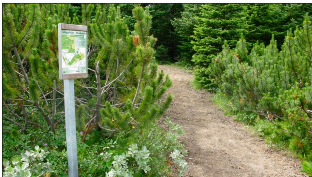
Eitt af fjölmörgum göngustígaskiltum í Heiðmörk

Allir voru sammála um að keppnishringurinn í Heiðmörk væri alveg frábær - hæfileg blanda af malarvegum og stígum sem allir komast. Mótið var haldið í lok júní og í heildina var það mjög vel heppnað. Allur undirbúningur var mjög góður sem og mótsstjórn og bæði keppendur og starfsmenn fóru ánægðir heim.