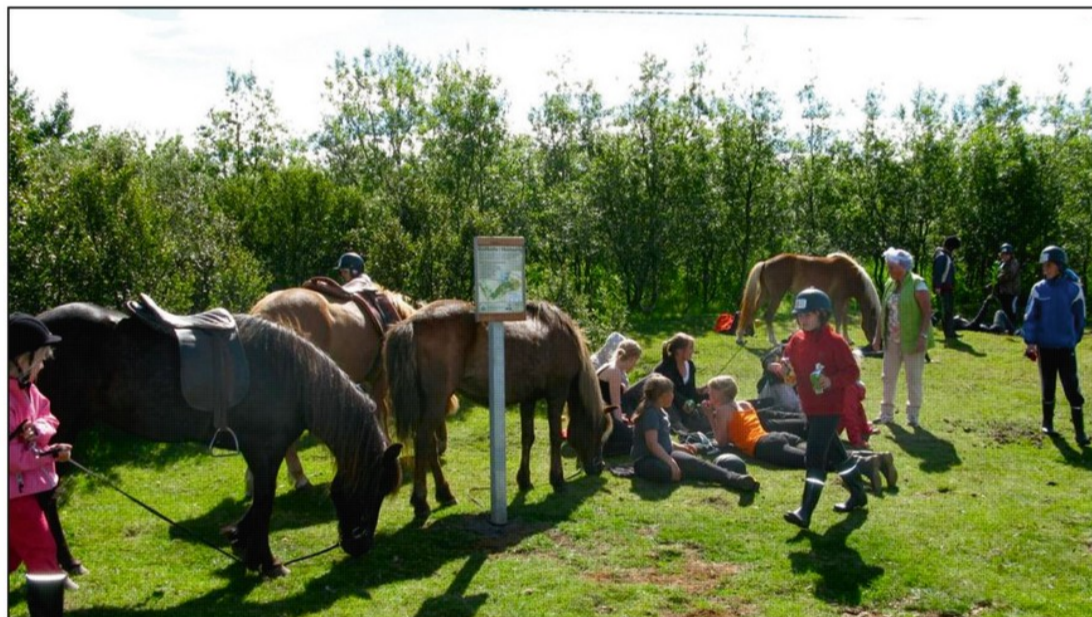
Margir reiðskólar leggja leið sína um Heiðmörk á sumrin og æja í hestagerðunum

Fleiri málum hefur verið unnið að í Heiðmörk og má þar nefna deiliskipulag svæðisins, sem hefur nú loksins verið vakið af Þynirósarsvefni, og vegabætur sem eru brýnar ekki síst þegar sameiginlegt hestahverfi fyrir 5000 hesta Kópavogs og Garðabæjar rís við útjaðar Heiðmerkur í landi Garðabæjar.