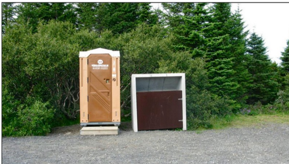
Nýtt ruslaskýli og „gámaklósett“ í Furulundi.

Við þetta aukna rusl bætist því miður að skemmdarstarfssemi virðist einnig hafa aukist samfara fjölgun gesta. Hefur borið nokkuð á því að einstaka gestir hafa skeytt skapi sínu á ruslakössum sem víða er að finna á svæðinu. Því lögðust starfsmenn vinnuflokks Skógræktarfélagssins í talsverða hugmyndavinnu við að hanna nýja ruslakassa. Var frumskilyrðið að þeir þyldu mun harkalegri umgengni en fyrri kassar sem voru smíðaðir úr timbri. Varð niðurstaðan sú að hætta með hefðbundna ruslakassa en smíða þá í staðinn úr forsteyptum ruslaskýliseiningum. Eru nýju ruslaskýlin því forsteypt bogaskýli sem síðan er smíðuð grind inn í úr stáli þar sem ruslapokarnir eru hengdir á. Eru síðan lokið og framhliðin úr 25 mm brenndum krossvið og allar lamir og annar búnaður af sterkustu gerð. Framleidd voru tvö slík skýli vorið 2008 og hafa þau reynst mun betur en gömlu kassarnir. Ekki hefur tekist að eyðileggja þau þrátt fyrir ýmsar árásir. Var annað þeirra sett við áningarstaðinn í Vífilsstaðahlíð en hitt ruslaskýlið var sett við Furulund. Nauðsynlegt er að halda þessari vinnu áfram og skipta út öllum gömlu kössunum og setja þessi steyptu skýli við alla áningarstaði í Heiðmörk. Reynslan er sú að góð ruslaaðstaða bætir mjög umgengni á svæðinu. Einnig léttir þetta til muna vinnu starfsmanna í Heiðmörk enda fer mjög mikill tími og orka í að halda svæðinu hreinu.