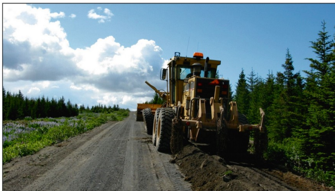
Vegaframkvæmdir í Heiðmörk

SR gerði átak í vegamálum og boðaði Vegagerðina, fulltrúa frá Orkuveitunni, Heilbrigðiseftirlitinu, Reykjavíkurborg og Landmótun á fund í Gamla salnum í maí. Varð niðurstaðan sú að Vegagerðin fór í umfangsmiklar endurbætur á veginum, hækkaði hann allmikið í þeim tilgangi að hann „drenaði“ sig betur. Einnig var sótt um að fá að bera trjákvöðuefni til að rykbinda veginn en slíkt efni mun vera notað með góðum árangri á erlendum vatnsverndarsvæðum. Það leyfi hefur þó ekki fengist enn. Vegurinn varð talsvert mjórri og brattari við þetta og allnokkuð var um útafakstur í vetur.