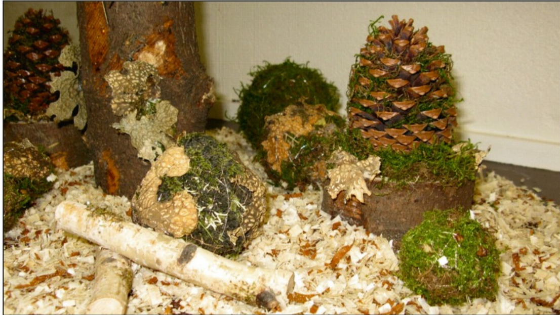
Jólaskraut unnið úr efniviði skógarins.

Minna fór fyrir áhuga á Blóma- og plöntugöngu, sem var haldin í samvinnu við Skógræktarfélag Íslands, sem og Trjágöngunni. Má ætla að hásumarið sé ekki góður tími fyrir atburði af þessu tagi, þar sem fólk er í sumarfríum og almennt út og suður.