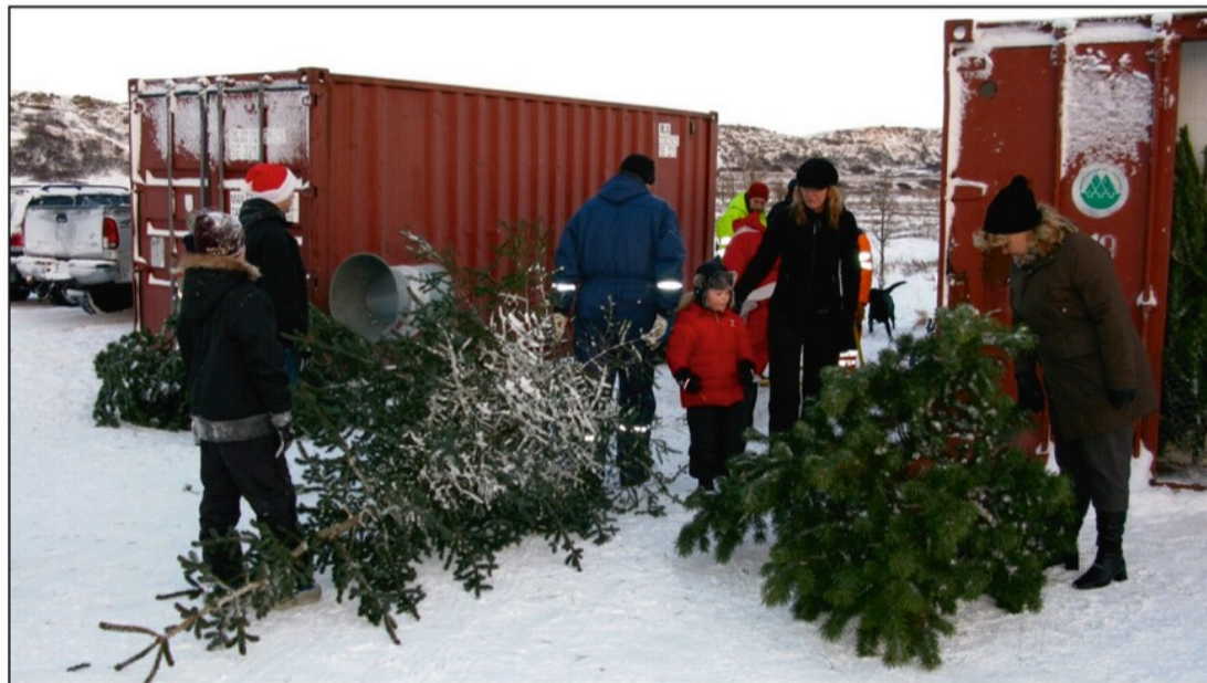
Það má bæði finna stafafuru og blágreni í Jólaskóginum í Hjalladal.

Á undanförunum árum hafa jólatré og ýmiss undirbúningur fyrir hátíðarnar orðið æ stærri þáttur í starfsemi Skógræktarfélagsins seinni hluta hvers árs. Einkum hefur verið um að ræða heildsölu á trjám til endursölu, bæði til blómaverslana og einnig til Flugbjörgunarsveitarinnar í Reykjavík. Sala á stærri trjám til sveitarfélaga og stofnana á höfuðborgarsvæðinu hefur aukist nokkuð og vonandi mun takast að stækka markaðshlutdeild félagsins á þessum markaði, því söluhæfum trjám í Heiðmörk hefur fjölgað ört og ár frá ári er hægt að bjóða hærri tré.