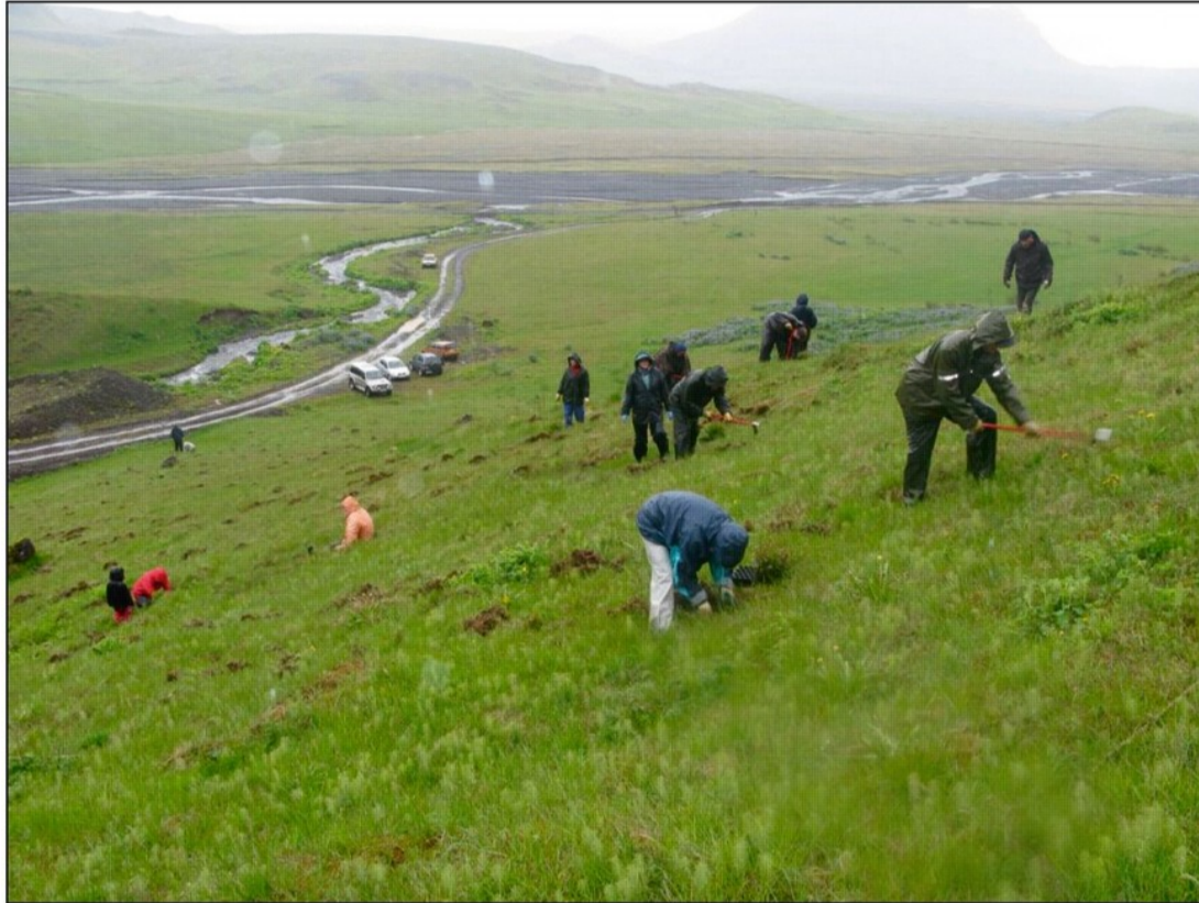
Við gróðursetningu í Fellsmörk.