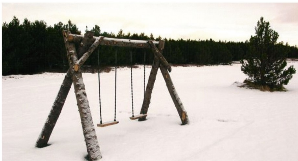
Rólurnar í nærmynd sem smíðaðar voru af starfsmönnum Vinnuflokks Skógræktarfélags Reykjavíkur. Íslenskt sitkagreni var notað við þessa smíð.

Leiktæki á áningarstöðum eru mikið aðdráttarafl, sérstaklega fyrir barnafjölskyldur. Þar sem slík tæki hafa eingöngu verið í Furulundi þá er hann mjög vel nýttur árið um kring. Á síðustu árum hafa starfsmenn Skógræktarfélagins unnið að uppbyggingu nýrra áningarstaða, til dæmis í Þjóðhátíðarlundi, sem er að mörgu leyti hugsaður sem nýr Furulundur. Til að auka nýtinguna á honum og hvíla Furulund þurfti leiktæki þar og því hófu starfsmenn vinnuflokks Skógræktarfélags Reykjavíkur þróunarvinnu við að hanna og smíða leiktæki úr því timbri sem til fellur við grisjun í Heiðmörk. Niðurstaðan varð sú eftir að hafa kynnt sér smíði slíkra tækja að smíða hefðbundnar rólur og þrautabrautir. Fer öll vinnan við að smíða leiktækin fram í aðstöðu félagsins að Heimaási. Allt timbur sem í leiktæki fer er heimaefngið sitkagreni, sverir bolir sem boltadir eru saman og gengið þannig frá öllum endum að ekki á að vera slyshætta af. Við þessa vinnu fæddust náttúrliga margar hugmyndir hjá starfsmönnum og vonandi verður hægt að bæta í á nýju ári og smíða fleiri rólur og þróa fleiri leiktæki. Eftir því sem grisjun í Heiðmörk eykst kemur sífellt meira efni sem hægt er að nýta í þessa skemmtilegu hluti. Þarna um að ræða ákveðið frumherjastarf sem færir fólki bæði gleði og ánægju auk þess sem þarna munu fæðast enn fleiri hugmyndir að skemmtilegum lausnum varðandi afþreyingu fólks í Heiðmörk.