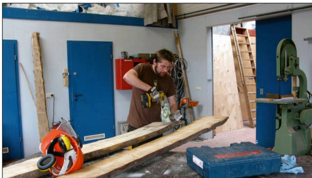
Unnið við smíði leiktækja í skemmu SR