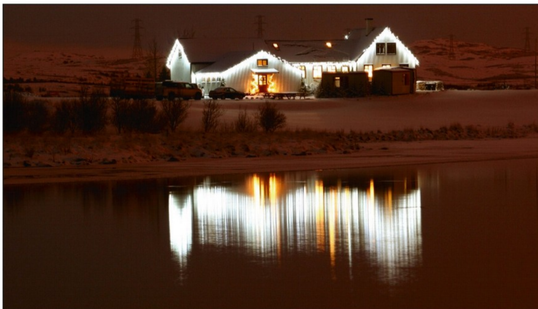
Ellidavatnsbærinn í jólabúningi