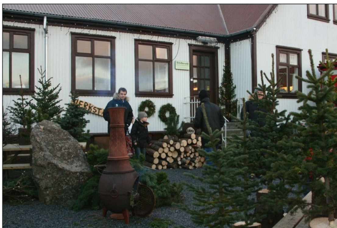
Af Jólahláðinu á Elliðavatni

Jólamarkaður var haldinn öðru sinni á Elliðavatni á aðventunni, eða fjórar helgar fyrir jól. Opnunartíma var breytt lítils háttar, opið var frá 11-17 í stað kl 18. Veður var með ágætum allar helgar, fyrstu helgina var snjólaust en mikið frost, en fallegur jólasnjór yfir öllu hinar þrjár. Aðsókn var mun meiri en í fyrra og má áætla að um 7500 manns hafi heimsótt Jólamarkaðinn þetta ár. Leiðin að Elliðavatnsbæ var merkt með skiltum og logandi ljósum og fáni Skógræktarfélags Reykjavíkur blakti við hún niðri við hlið. Mikil gleði var meðal borgarbúa með Jólamarkaðinn og greinilegt að fólk er ánægt að fá að leita hingað í Heiðmörkina á þessum árstíma og vera boðið upp á jólastemningu í fallegu umhverfi jafnframt því að geta keypt sér jólatré eða jólagjafir, og skemmt börnunum. Einnig var greinilegt að ásókn göngufólks jókst til muna á tímabilinu og um jól og áramót, svo ætla má að jólamarkaðurinn sé góð kynning fyrir útivistarparadísina Heiðmörk.