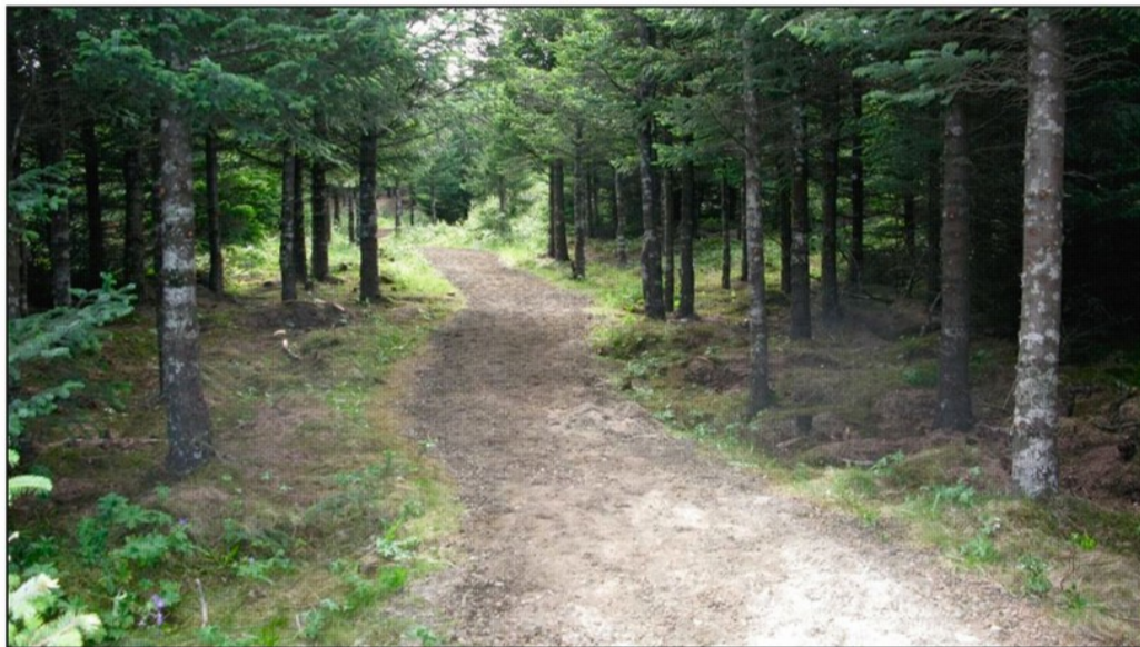
Útsýni inn í skóginn eykst mikið við uppkvistun á völdum stöðum og skógartilfinning gesta verður meiri.

Á næstu árum verður vinnu við þetta fram haldið þar sem skógurinn er víða farinn að þrengja að göngustígnum.