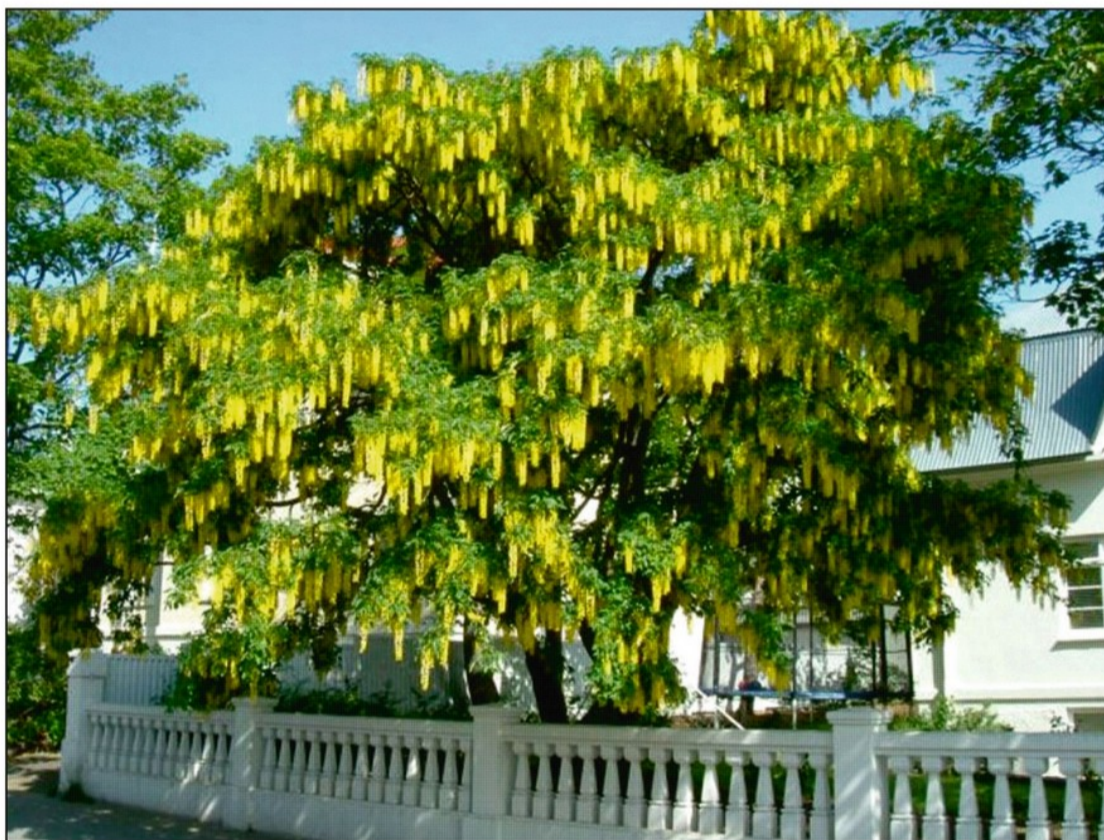
Gullregn var valið Tré mánaðarins í júní.

Í júní hófst tólf mánaða verkefni hjá Skógræktarfélaginu sem kallað er Tré mánaðarins og fellur það vel að fræðslumarkmiðum félagsins. Hugmynd var að velja eitt tré á mánuði í Reykjavík sem á einhvern hátt þótti bera af öðrum, til dæmis óvenjulega tegund, óvenjulegt í laginu, með óvenjulega sögu o.s.frv. Sem sagt, merkilegt tré að mati borgarbúa og sem dómnefnd á vegum félagsins samþykkti. Ábendingar hafa borist og er hver og ein þeirra vegin og metin. Síðan hefur verið gerð grein fyrir trénu, sögu þess og eftir atvikum íbúum í viðkomandi húsi, tréð mælt, myndir teknar og greinagerðin birt á heimasíðu félagsins og send til fjölmiðla. Einnig hefur það verið kynnt í útvarpsþættinum „Út um græna grundu“ á laugardagsmorgnum á rás eitt Ríkisútvarpsins. Á heimasíðu félagsins heidmork.is má sjá þau tré sem valin hafa verið fram til þessa. Hugmyndin er síðan að gefa út bækling eftir að verkefninu lýkur og vekja enn frekari athygli á þeim menningarverðmætum sem tré í görðum geta vissulega verið.