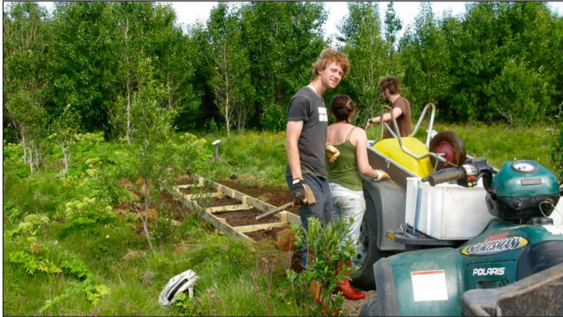
Brúarsmiðiflokkur Skógræktarfélags Reykjavíkur að störfum.