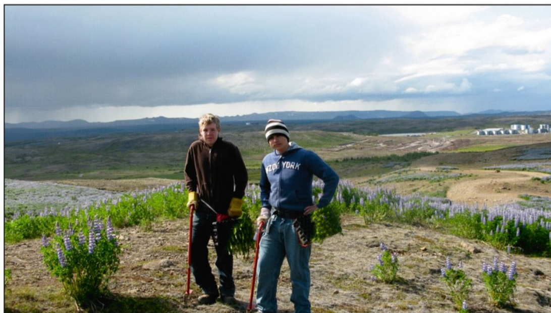
Sumarstarfsmenn vinna við gróðursetningu í Úlfarsfelli júní 2008

Unglingar frá Landsvirkjun aðstoðuðu einnig við að rífa niður og fjarlægja girðingadræsur í framhlaupinu, en þær höfðu lokið hlutverki sínu fyrir löngu.