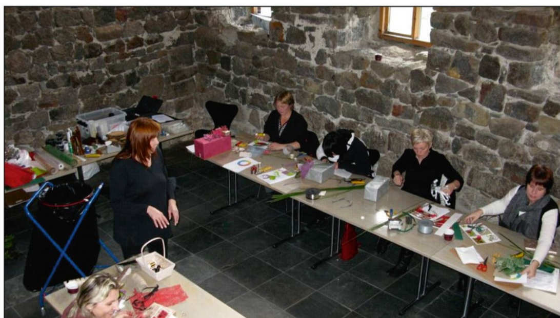
Námskeiðahald í Gamla sal á Elliðavatni

Eins hefur „Gamli salur“ verið leigður til einstaklinga og félagasamtaka, fyrir atburði og samkomur af ýmsum toga.