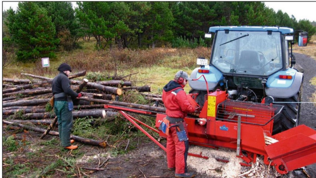
Hér er verið að vinna timbur í eldivið.