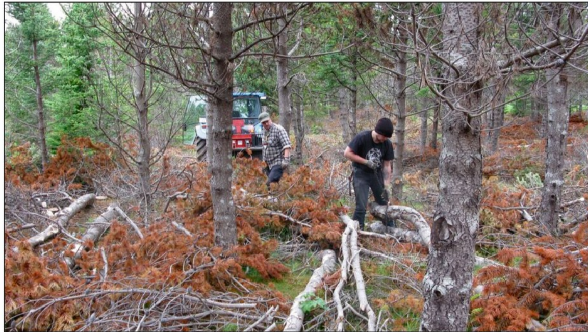
Starfsmenn félagsins að störfum við útdrátt í reit í „Pípó“ sem grisjaður var haustið 2007.

Í ljósi þeirrar miklu grisjunarþarfar sem er í skóglendum Heiðmerkur þá hefur á síðustu árum verið reynt að grisja sem mest. Á árinu 2008 voru grisjaðir um 6,2 ha. af bæði stafafurureitum sem og sitkagrenireitum. Stafafuran er nokkuð viðkvæm fyrir því að fá ekki umhirðu sem skyldi. Því hefur verið lögð sérstök áhersla á að grisja unga stafafurureiti en einnig hafa nokkrir eldri fengið að fljóta með. Á árinu var einnig lokið við að draga út allt efni sem fellt var sem og allt það efni sem ekki hefur verið dregið út á undanförunum árum.