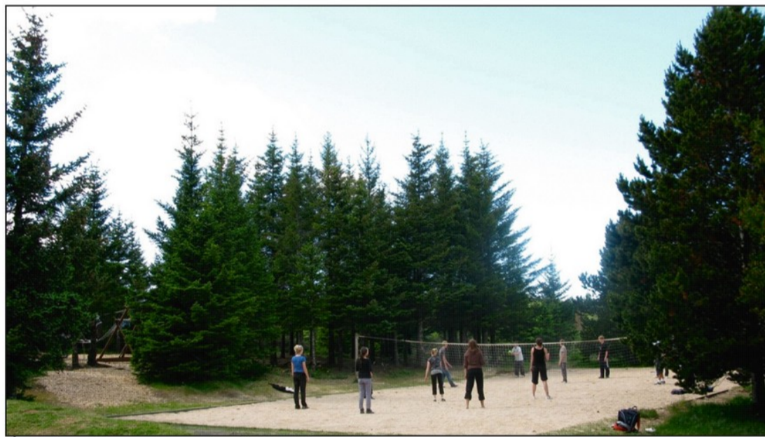
Á blakvellinum í Furulundi í Heiðmörk

En tímafrekastar hafa þó verið viðræður okkar við borgina vegna Heiðmerkur og er óhætt að segja að þær hafa verið ákaflega þreytandi