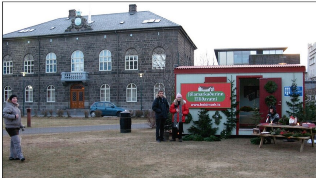
Kynning Skógræktarfélags Reykjavíkur á Jólamarkaði Elliðaavatns á Austurvelli 1. desember