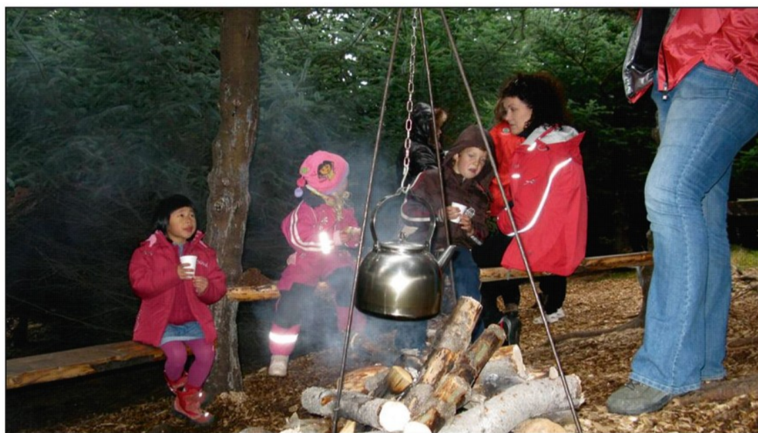
Góður kakósopi hitaður á hlóðum í Fræðslurjóðrinu á Elliðavatni

Viðamesta verkefnið sem þannig hefur orðið til í samstarfi skóla, Náttúruskólans og Skógræktarfélagsins er heimilisfræðikennsla elstu nemenda Ísaksskóla, sem skólaárið 2008-2009 fer fram einu sinni í mánuði í útikennslustofunni. Nemendur dvelja hálfan skóladag í Heiðmörk, vinna að verkefni sem tengist umhverfinu, auk þess sem þeir matreiða einfalda rétti yfir opnum eldi í rjóðrinu. Skógræktarfélagið hefur útvegað eldivið til eldamennskunnar en þegar matreitt er yfir opnum eldi eru gæði eldiviðarins mjög mikilvæg.