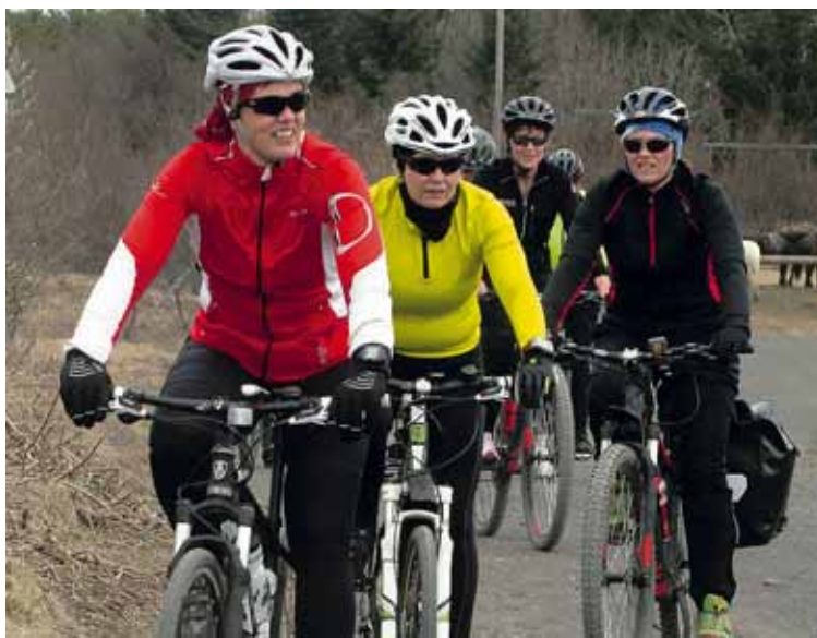
Útivist Stígkerfið í Heiðmörk er þéttrið og á fállegum vordögum er svæðið vinsælt til dæmis meðal hjólréiðafólks og hestamanna.

Við gróðursetjum þúsundir plantna í Heiðmörk á hverju einasta ári. Myndum raunar vilja gera enn betur þar.