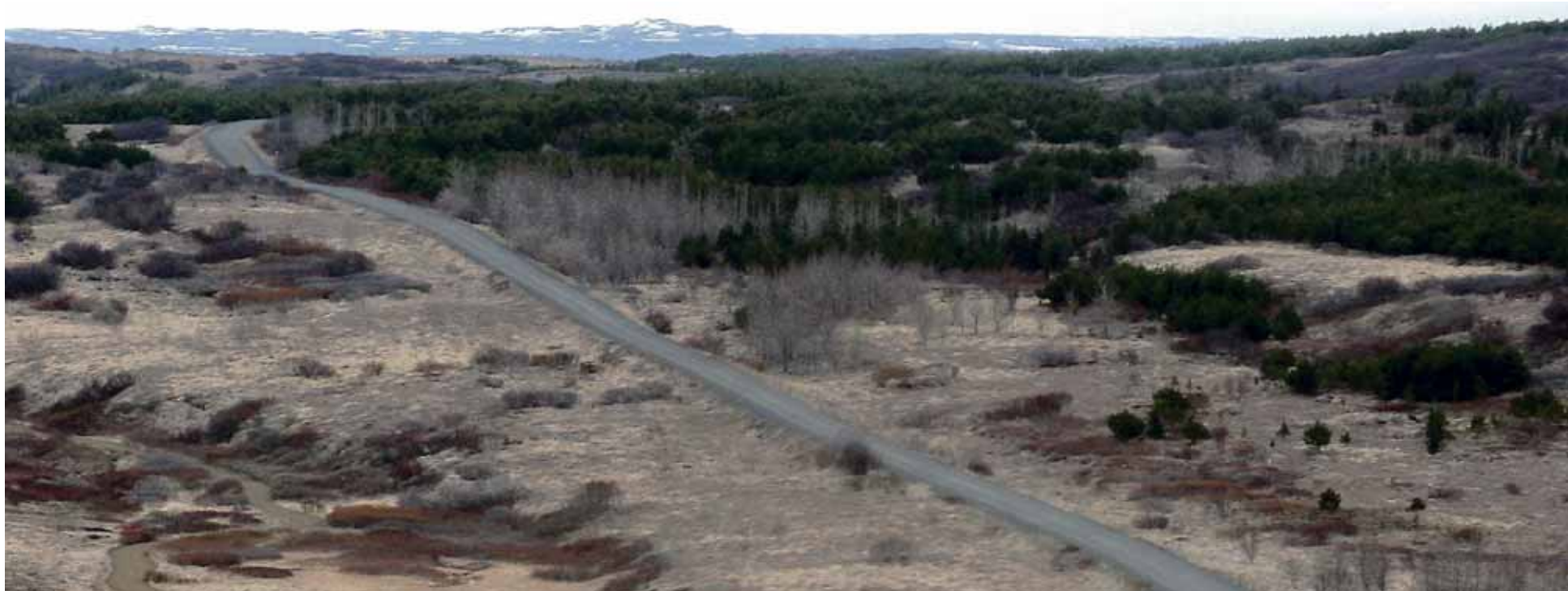
Skóglendi Heiðmörk nær yfir rúmlega 3.000 hektara og þvert í gegnum svæðið er um 13 kílómetra langur vegur, frá Rauðhólum suður í Vífilstaðahlíð.