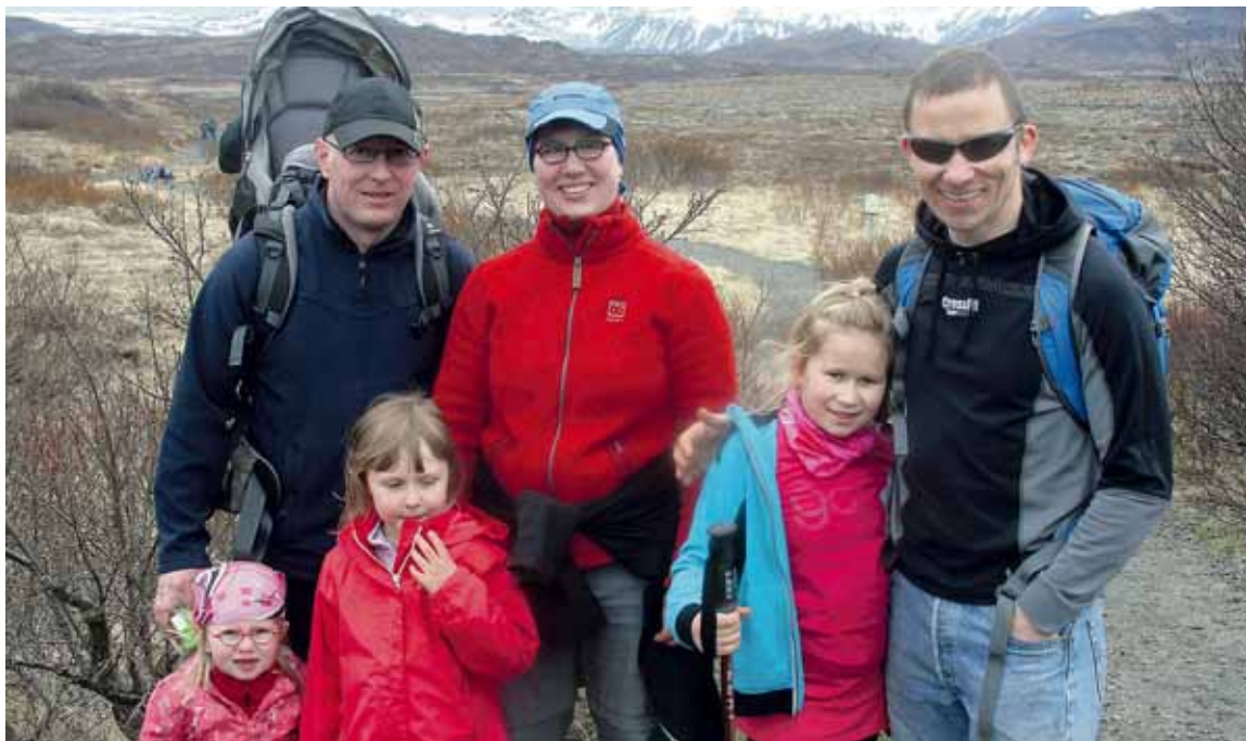
Samvera Gæðastund fjölskyldunnar sem fór í gönguferð um Búrfellsgjá syðst á Heiðmerkursvæðinu.